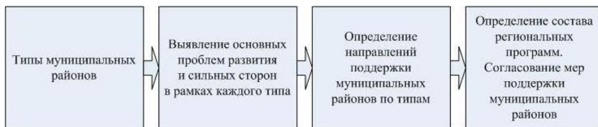
Рисунок 2. Формирование состава региональных программ, определяющих направления поддержки муниципальных районов

Другим важным аспектом в рамках стратегического планирования регионального развития согласно представляемому методическому подходу является возможность рекомендовать муниципальным районам направления стратегического развития, либо согласовывать совместные действия органов государственной власти субъекта РФ и органов местного самоуправления муниципальных районов, сделать систему стратегических документов этих двух уровней управления взаимодополняющей.