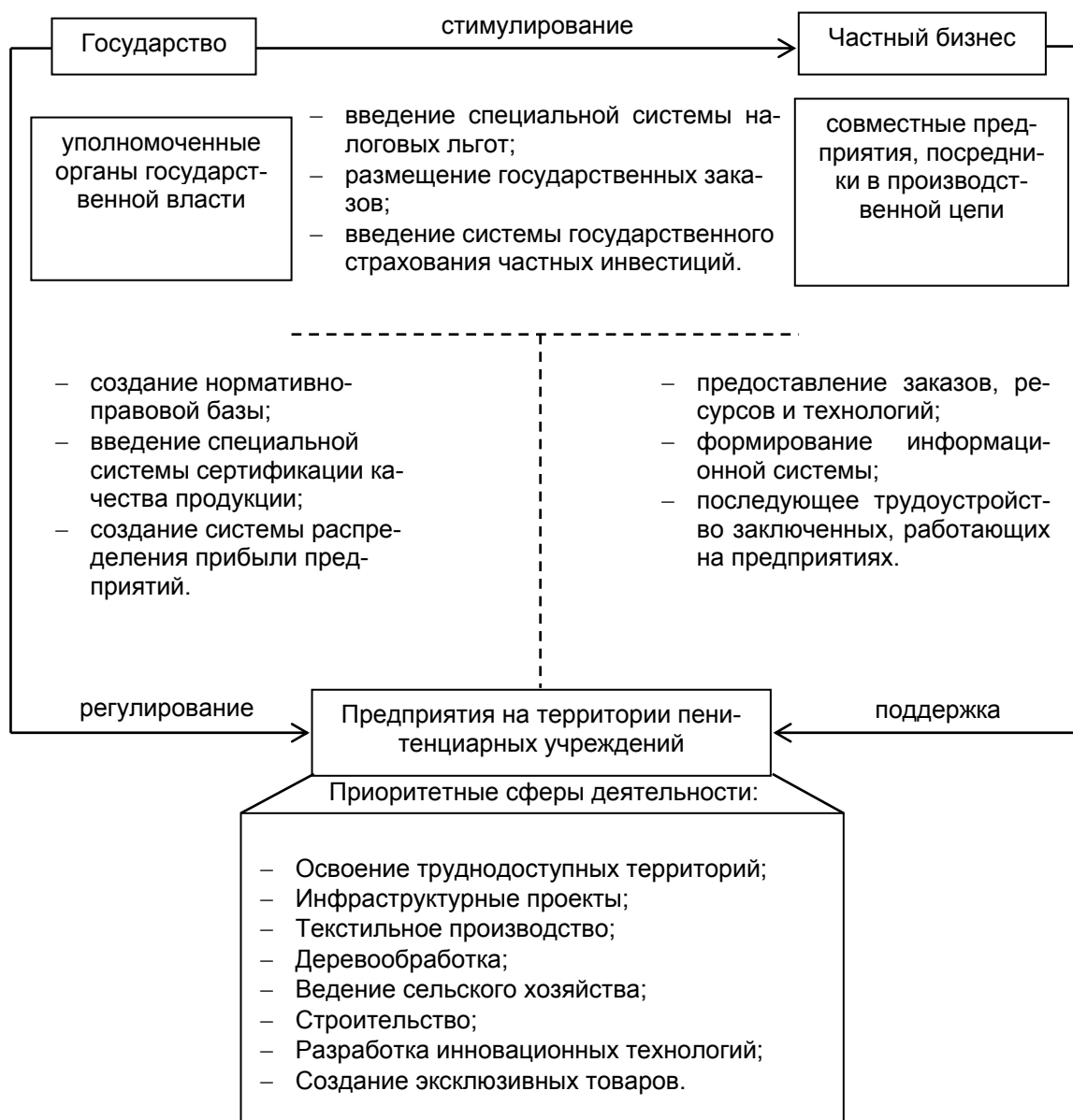
Рисунок 3. Модель развития предпринимательства на территории пенитенциарных учреждений