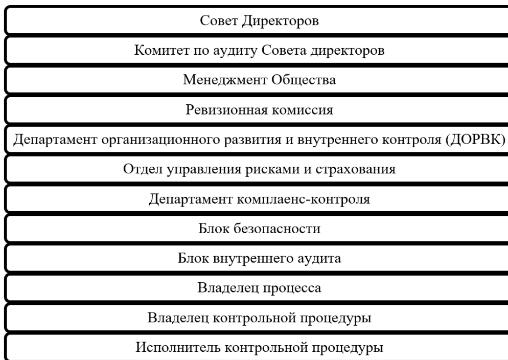
Рисунок 1. Система внутреннего контроля ПАО «Уфаоргсинтез» ПАО «АНК Башнефть» Figure 1. Ufaorgsintez PJSC ANK Bashneft internal control system

Система внутреннего контроля ПАО «Уфаоргсинтез» ПАО «АНК Башнефть» представлена на рис. 1.