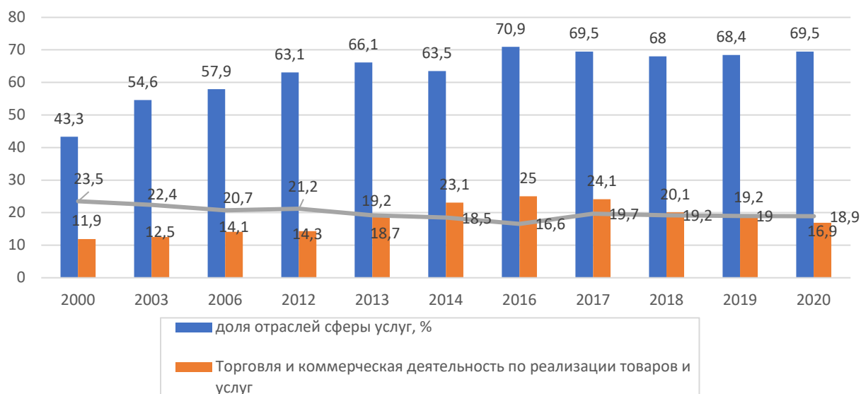
Рисунок 2. Динамика структуры ВРП Ивановской области: сфера услуг; торговля и коммерческая деятельность по реализации товаров и услуг в сравнении с обрабатывающим производством, %