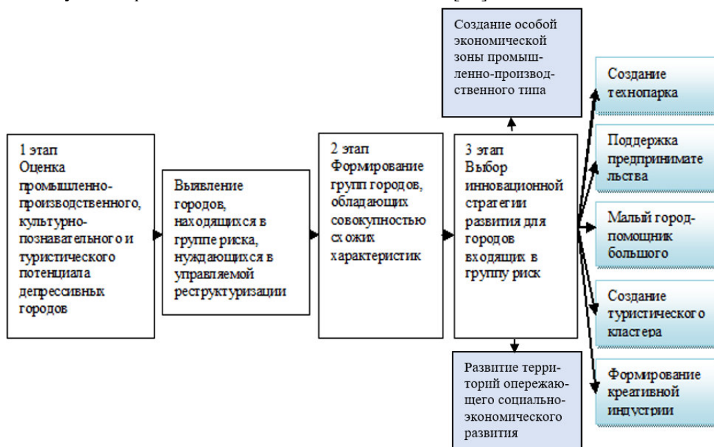
Рисунок 1. Комплексный подход регионального развития депрессивных городов, основанный на инновационной реструктуризации их производственно-хозяйственной деятельности

онную стратегию реструктуризации экономики: создание технопарков, диверсификация экономики промышленного города на развитие предпринимательства, формирование туристических кластеров, образование градообразующей связки «малый город-помощник большого», развитие «креативной» индустрии, создание особых экономических зон промышленно-производственного типа, развитие территорий опережающего социально-экономического развития (рис.1). Подобная комплексная системная работа органов власти, научного сообщества и предпринимательской сферы позволит решить проблемы малых городов и вывести их на новый этап развития. Комплексное решение проблем малых городов позволяет сформировать, удержать и развивать в них человеческий капитал [20].