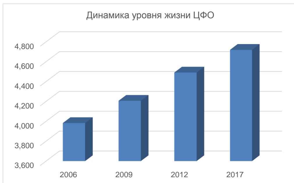
Рисунок 3. Общая динамика уровня жизни регионов ЦФО с учетом инфляции