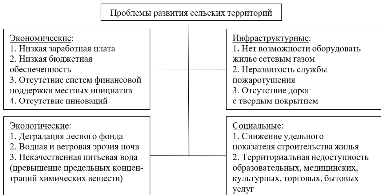
Рисунок 1. Проблемы развития сельских территорий (составлено авторами)